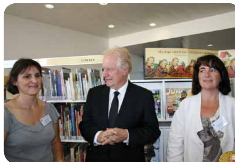
Visite de la bibliothèque avec les deux bibliothécaires de la CCPC

« Il est heureux que cette bibliothèque existe où on pourra y trouver, comme a dit Marcel Proust en parlant des livres, tous ces amis qui sont sur les étagères. » André Dussollier