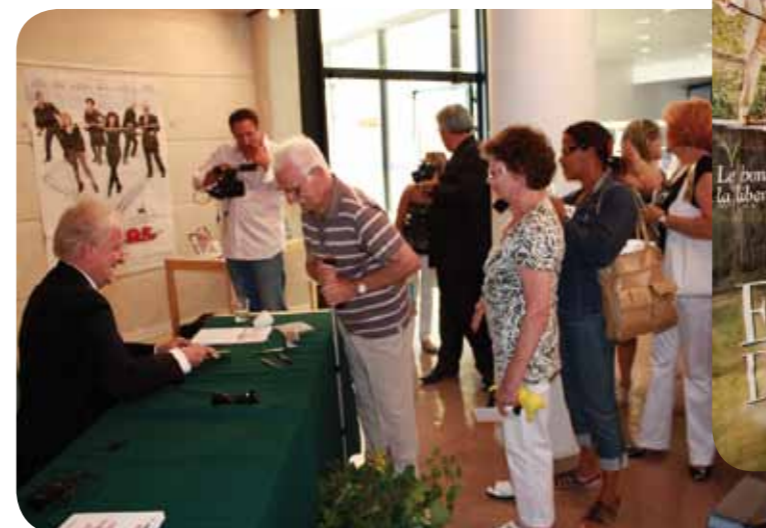
Séance d'autographes avec les lecteurs

« Bref Cruseilles, pour moi, c'était une scène de théâtre avec des acteurs qu'aujourd'hui je suis heureux de retrouver, qui n'ont rien perdu de leur verve, de leur talent comique et de leur générosité. C'est aujourd'hui encore comme un livre plein de héros toujours vivants dans ma mémoire. »