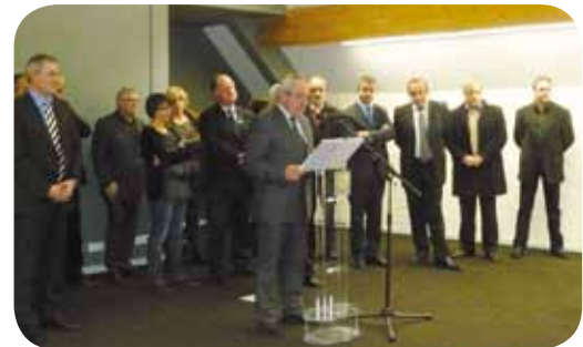
Discours du Président

Ce fut l'occasion de rappeler le dynamisme du territoire et sa volonté d'aller de l'avant sans perdre de vue l'intérêt général : il a évoqué toutes les réalisations, qui sont, dit-il, le fruit du travail des élus et des agents de la CCPC. Le fruit de choix ambitieux mais responsables. Les élus ont su se mobiliser et se fédérer autour de ces projets. Certes, il reste encore beaucoup à faire. Il a précisé que les investissements se poursuivront, sans nul doute, au terme de ce mandat, sur l'ensemble du territoire. Et de conclure « Je sais pouvoir compter sur vous, en 2011 et jusqu'en 2014, pour entretenir, valoriser, inventer notre patrimoine, et poursuivre ce chemin que nous avons tracé ensemble. »