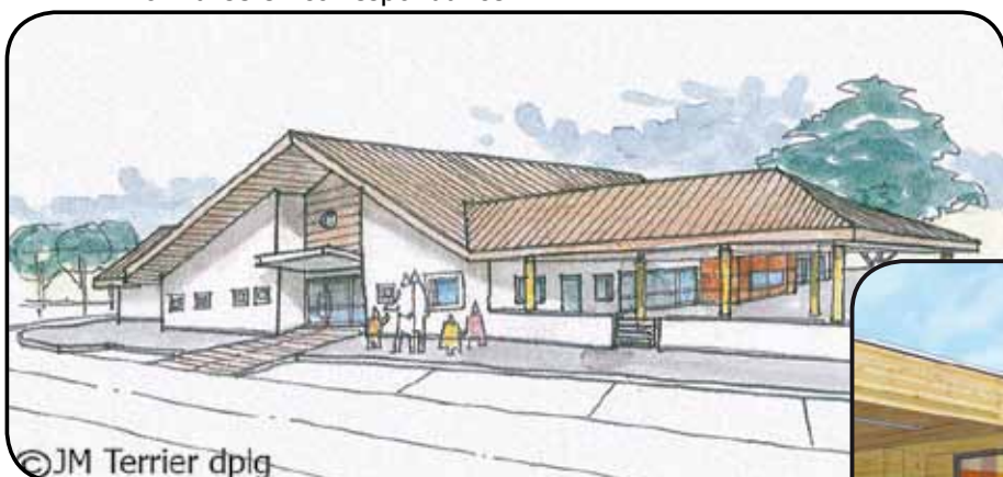
Toits en pente : École maternelle de Villy-le-Pelloux