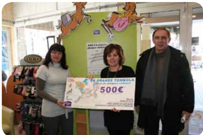
La 1 ère gagnante de la commune de Choisy