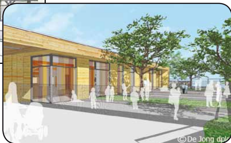
Toits terrasses : Structure petite enfance