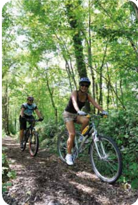
Promenade en VTT