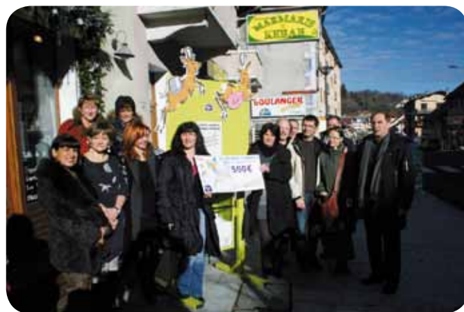
Tirage au sort chez Les Secrets d'Hortense le 11 décembre 2010