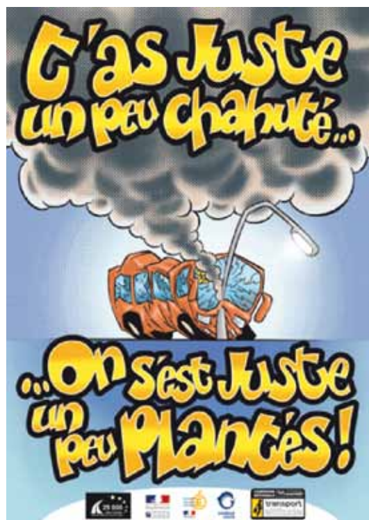
24 ème campagne nationale sur la sécurité 2010 - 2011