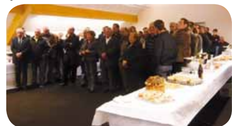
Élus, personnels, enseignants, acteurs économiques