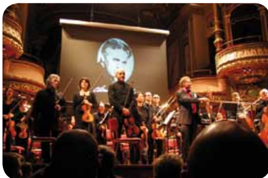
Souvenir de notre sortie « Ciné-Concert » au Victoria Hall à Genève avec les classes de solfège de l'école de musique le 16 décembre 2010.

D'autres projets se profilent en ce début d'année avec tout d'abord un échange entre 4 classes de saxophones du département pour un court séjour à Paris : visite de l'atelier Selmer (fabrique d'instruments) et de l'Assemblée nationale, et pour terminer la journée en musique, nous prévoyons un petit concert au salon de l'agriculture le 25 février.