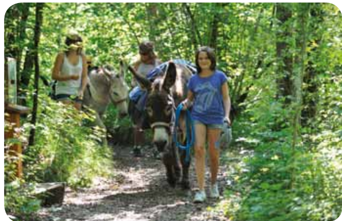
Balade avec des ânes