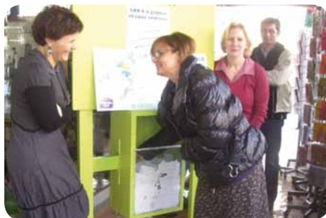
Tirage au sort par une main innocente