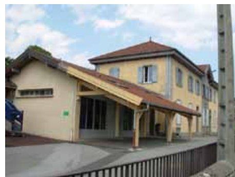
Nouveau préau de l'école d'Andilly/Charly

Une étude prospective sur le Centre nautique Bernard PELLARIN devrait être lancée afin d'étudier les travaux d'amélioration et de remise aux normes du site à prévoir.