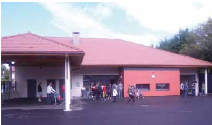
Rentrée scolaire dans la nouvelle école maternelle de Villy-le-Pelloux