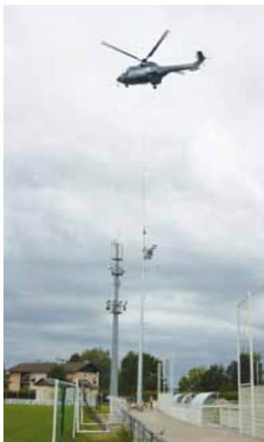
Hélicoptage au stade des Ebeaux