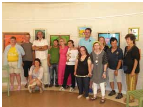
Les peintres, les comédiens et les éducateurs réunis devant les tableaux