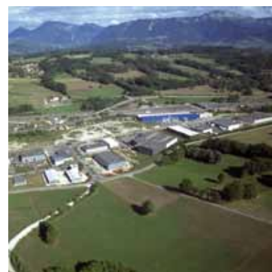
Les Zones d'Activités