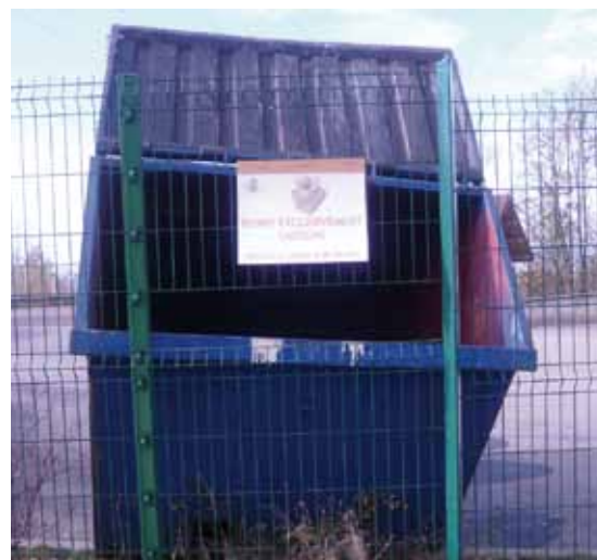
Benne à cartons à la déchetterie

Pour faciliter la collecte, les cartons doivent être vidés de leur contenu, compactés ou déchiquetés sans films plastiques ni polystyrène.