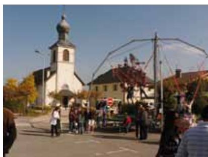
Fête de l'automne

Retrouvez toutes les infos sur le site Internet de la commune : www.cuvat.org