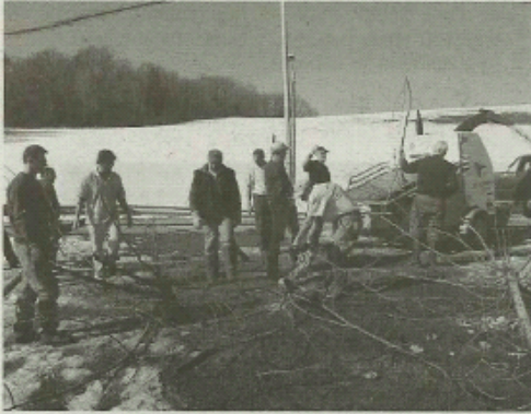
On s'affère autour de la machine pour broyer branchages et ronces.