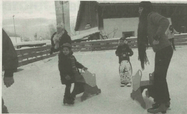
Dimanche dernier, parents et enfants ont connu les plaisirs de la glisse sur patins, le temps d'un après-midi ensoleillé.

Louée par l'association d'Andilly Loisirs auprès de la société "FCO Events", à Allonzier-la-Caille, elle offre aux personnes la possibilité de ne faire que du patin ou la visite de sa demeure, ou les deux. Depuis le 7 février et jusqu'au 8 mars, l'option pour visiter le hameau du père Noël permettra d'avoir la location gratuite des patins. Ouvert tous les jours de 14 h à 18 h, le père Noël vous convie à ses deux nocturnes qui se dérouleront les 13 et 20 février jusqu'à 22 h. De plus, il chaussera ses patins pour votre plus