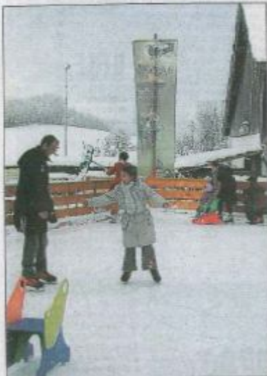
C'est "holiday on ice" tous les jours chez le père Noël !