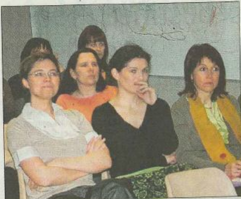
Une assistance attentive aux nouveaux projets de "Touchatou".