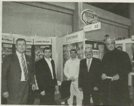
Au cours de la visite des 30 stands qui ont tous en commun le thème du développement durable.

veut faire un geste pour la planète. « C'est tout l'avenir de nos enfants qui est en jeu. La préservation de notre environnement passe par la sensibilisation des gens aux énergies propres. Les solutions existent et nous y contribuons, avec ce salon et grâce