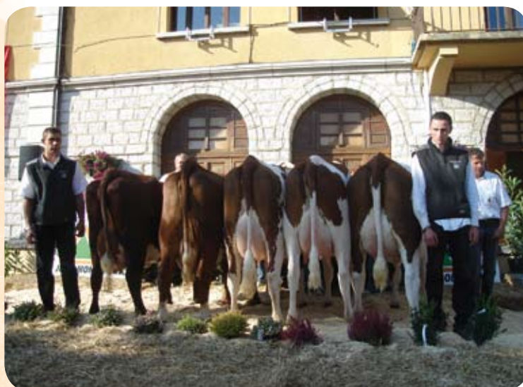
Vainqueur du canton de Cruseilles : challenge inter-cantonal à Valleiry le 21/10/2008. 2 races d'Abondance - 3 races Montbéliard.