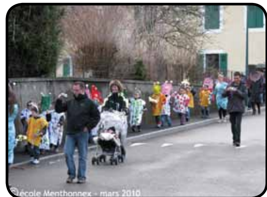
Défilé des élèves déguisés en peuple du monde