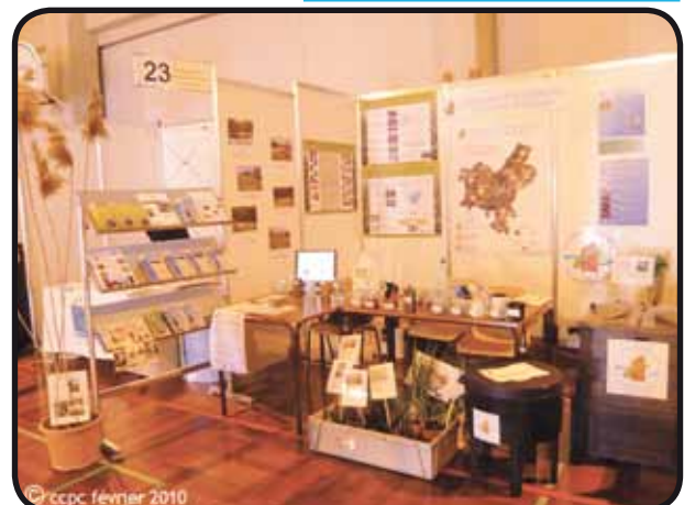
Stand de la Communauté de Communes du Pays de Cruseilles Plantes (macrophytes) prêtées par le CAT de Chosal