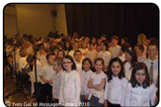
Spectacle les Histoires Pressées

Aujourd'hui, l'école de musique de l'harmonie Cruseilles/Le Châble a su prouver qu'une collaboration avec les écoles était possible grâce à une personne relais : l'intervenante musicale en milieu scolaire, poste clé que nous souhaitons pérenniser car ce type de projet qui mêle la musique et l'école de musique au scolaire devrait se développer à l'avenir.