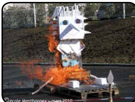
Monsieur Hiver fabriqué par les élèves

Après un hiver long et rigoureux, les élèves de l'école de Menthonnex-en-Bornes ont décidé d'en finir avec l'hiver en mettant Monsieur Hiver au bûcher. On prétend que si le bonhomme Hiver brûle vite, l'été sera chaud. Pour l'occasion, les élèves ont défilé et chanté, thème du carnaval de cette année «les peuples du monde» en lien avec les semaines d'éducation contre le racisme et la discrimination.