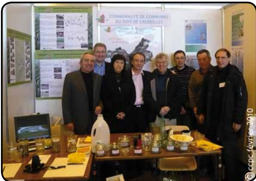
Président, vice-présidents et personnels de la CCPC

Le tri sélectif, impulsé par la CCPC, a également été mis à l'honneur : un conteneur à vêtements a été installé sur le parking du gymnase. 30 kg de vêtements ont été récoltés. Une bonne action de solidarité.