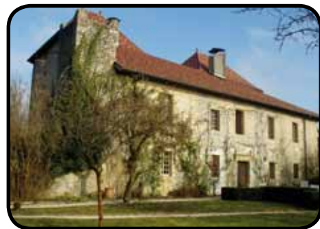
Château de Cernex

Au centre du village, le «Fort» est une grosse maison, très ancienne, dépendance du château. Ses façades laissent à penser qu'il y avait un pont levé. Il se dit même qu'une galerie rejoignait les deux édifices... Ce fort a abrité une petite tannerie pour la fabrication du cuir.